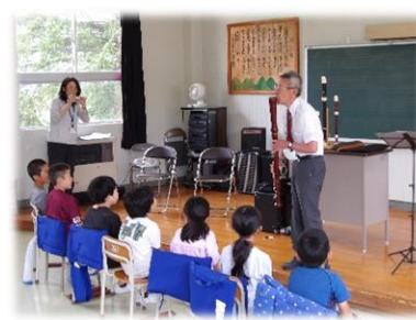
3年 リコーダー講習会