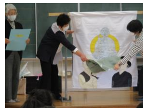
↑ 前回の読み聞かせ全体会

子供たちの読書活動推進のために、令和5年度から落合チャレンジとして「親子読書」に取り組んでいただいています。図書室では親子読書におすすめの本のコーナーも設置しており、積極的に本を借りようとする子供たちも見られます。また、地域ボランティアさんによる読み聞かせも、本に対する興味を高めています。10月2日(水)には読み聞かせ全体会を予定しています。保護者の皆様もご参加いただけますので、親子読書の一環として読み聞かせをお聞きになりませんか？12:55～です。多数のご参加をお待ちしております！