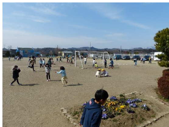
3月11日（金）。業間、暖かな陽気が春の訪れを感じさせます。校庭は元気に遊ぶ子供たちの姿で一杯です。