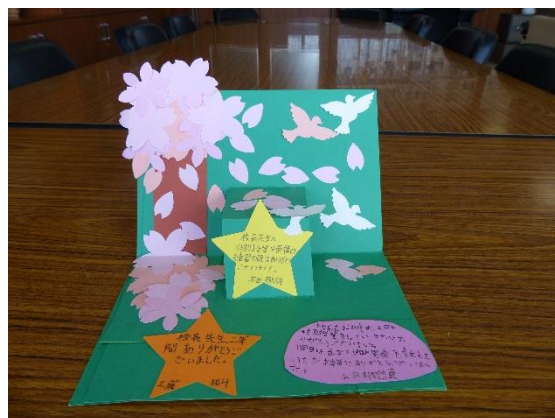
3月10日（木）。昼休み、6年生の代表3名から卒業にあたって感謝のメッセージカードをいただきました。「飛び出す絵本」を彷彿とさせる立体的なカードに感激しました。