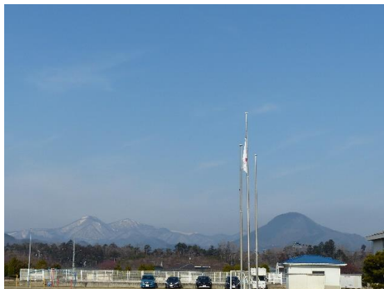
3月11日（金）。「白い光の中で 山脈は萌えて・・・」北泉ヶ岳も春の装いです。今日はみやぎ鎮魂の日。東日本大震災でお亡くなりになった方々への弔意を表すため半旗を掲揚し、震災発生時刻午後2時46分には全校で黙とうを捧げます。