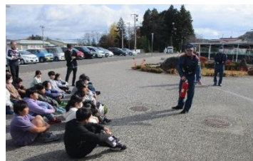
消火器は「ピノキオ」で覚えて