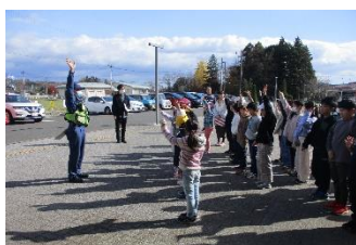
校庭にしっかり避難できた人？

これから寒くなり暖房器具を使うことが増え、空気が乾燥して火事が起きやすい季節となります。学校でも家庭でも火事を出さないこと、自分の命は自分で守る意識を持って生活することを伝えていきましょう！