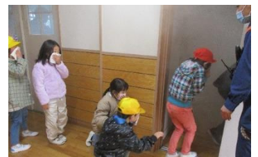
煙があるときは姿勢を低くして！