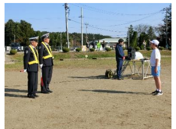
見守っていただいたお二人