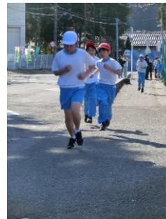
最初からデットヒート5・6年