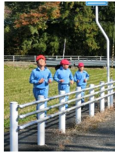
苦しくてもゴールへ3・4年