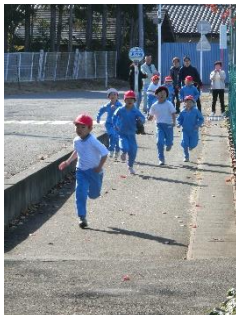
元気にスタート1・2年