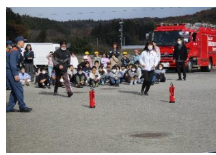
「火事だー」と火元へ