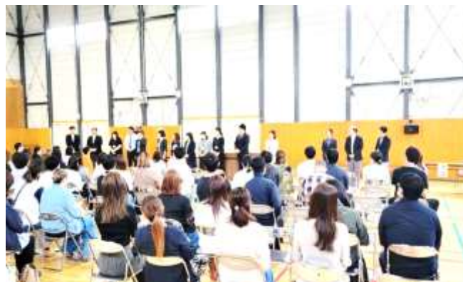
～PTA総会にもたくさんの皆様にお集まりいただきました～

4月27日(土)に実施した授業参観、PTA総会、懇談会にはたくさんの保護者の皆様にご参加いただき、ありがとうございました。事後アンケートでは「一生懸命勉強している姿を見て安心した。」「総会に参加して活動について知ることができた。」等のお声をいただきました。廊下や教室の混雑状況、場所等の連絡方法につきましては、ご迷惑をお掛けし申し訳ありませんでした。今後、改善に向けて話し合いを重ねていきます。